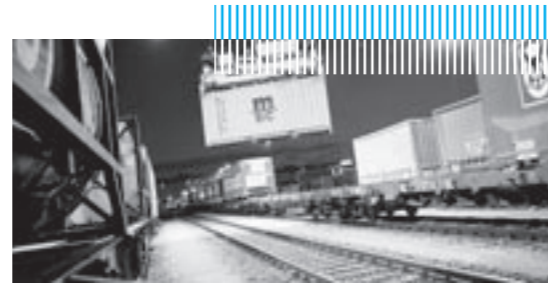
Unternehmensnahe Dienstleistungen werden bis 2011 wichtigster Beschäftigungsmotor in NRW.

165.000 Arbeitsplätze entstehen. Die Branchen mit dem stärksten Beschäftigungswachstum in NRW sind die unternehmensnahen Dienstleistungen mit 74.900 und das Gesundheitswesen mit 69.000 neu geschaffenen Arbeitsplätzen. Mit Abstand folgen die Herstellung von Metallerzeugnissen mit rund 15.400 neuen Beschäftigten, das Baugewerbe mit 14.000 Arbeitsstellen und die Softwarebranche, die für 11.800 neue Stellen sorgt. Besondere Wachstumstreiber sind laut den Experten die Industriestandorte. Die ersten acht Plätze der Top-Wachstumsstandorte belegen Städte. Eine Mischung aus Dienstleistung und technologieintensiven Industrien macht den „Treibsatz“ aus. An der Spitze liegen Aachen, Leverkusen, Essen, Solingen und Remscheid; gefolgt von Oberhausen, Münster und dem Ennepe-Ruhr-Kreis. Auch die Clusterpolitik des Landes NRW nahmen die Forscher unter die Lupe. Ihre Ergebnisse belegen, dass eindeutige Wachstumseffekte durch die