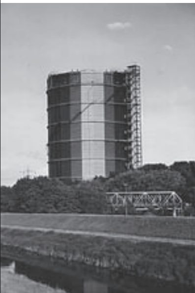
Der Gasometer in Oberhausen steht für den Strukturwandel in der Region.

eigenen Beitrag zu leisten, verpflichteten sich die Unternehmen, zukünftig ihre Aufgaben für Forschung und Entwicklung (F&E) deutlich auszubauen. Der Initiativkreis will verstärkt F&E-Gelder ins Ruhrgebiet ziehen. Ziel ist die Schaffung eines „Meta-Clusters“, in dem Forschung, Entwicklung und Produktion Spitzenleistungen im internationalen Wettbewerb erbringen können. Neben allen wirtschaftlichen Handlungsfeldern spielt Kultur als Standortfaktor für das Ruhrgebiet eine wichtige Rolle. Auf die Ereignisse im Rahmen der Kulturhauptstadt Europas Essen 2010 sollen weitere Großereignisse folgen, um den Ruf der Region zu stärken. Und zu guter Letzt setzt die Initiative auf ein verstärktes Regionalmarketing durch die regionale Wirtschaftsförderung. Anstatt getrennt auf kommunaler Ebene zu agieren, sollen Städte und Kommunen auf regionaler Ebene an einem Strang ziehen. Die Ruhrkreisinitiative strebt hier ein übergreifendes Marketingkonzept für das Ruhrgebiet an.